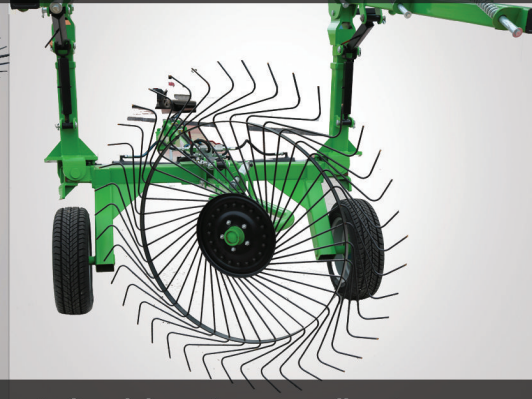
Individual moving arms allow to one way harvesting opportunity