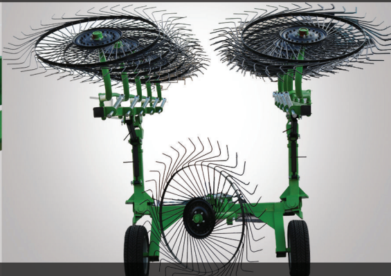
Safety road handling position